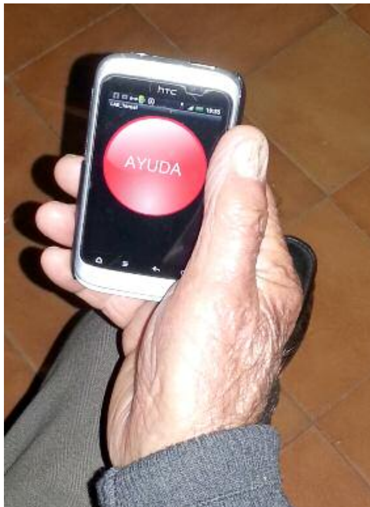
La APP para atender posibles caídas de ancianos se utiliza en móviles inteligentes

Plaza, por que la tecnología sea una herramienta "que ayude a mejorar el bienestar de los mayores, tanto físico como mental para mejorar su calidad de vida".